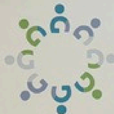
TABLE DES ORGANISMES